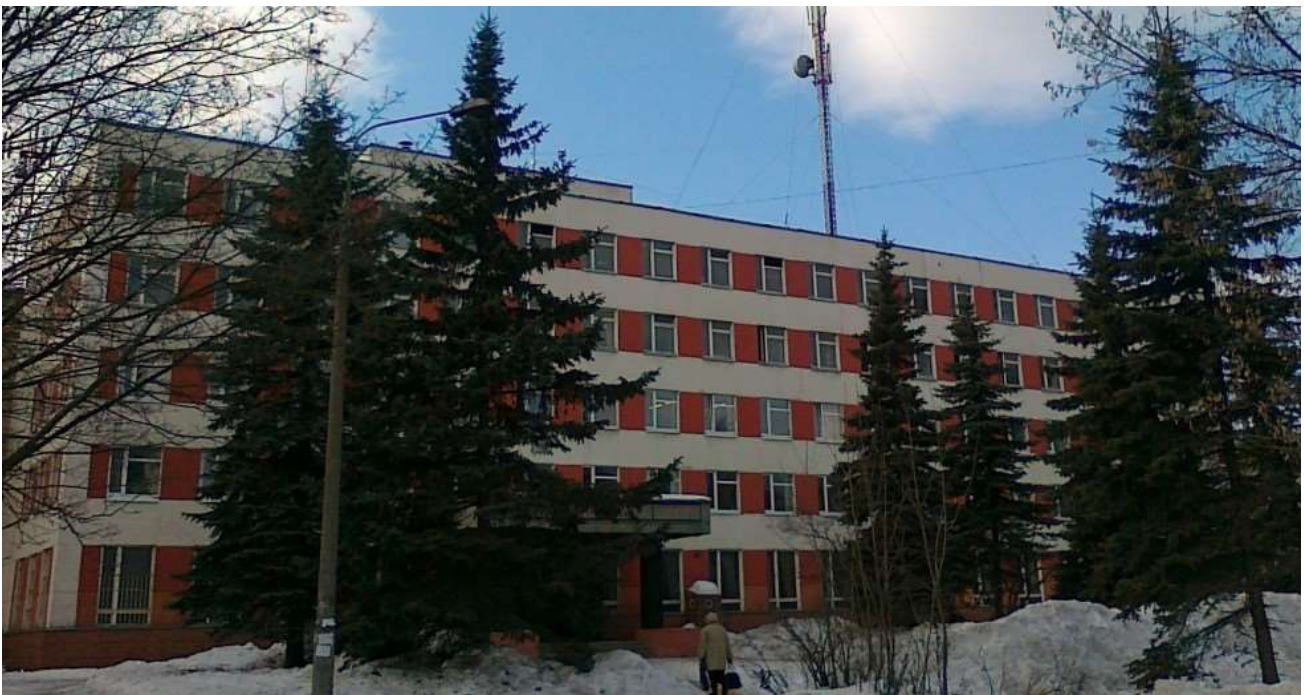
Рис. 3. Здание ВСЕГИНГЕО в поселке Зелёный Московской области [56]

Это также было уникальное геологическое научно-производственное предприятие. Оно в свое время стало отправной точкой при разработке советских стандартов для инженерных изысканий. Там работали основатели многих научных направлений и школ, давших начало ряду теоретических, методических и прикладных направлений гидрогеологии, инженерной геологии, геокриологии и геоэкологии.