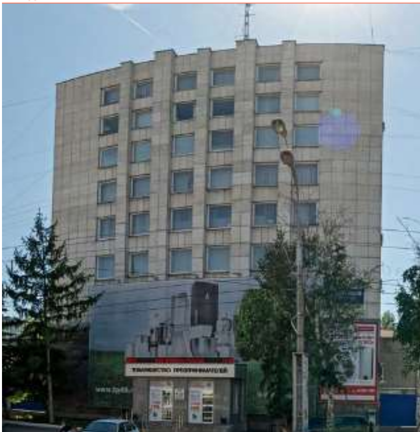
Рис. 6. Панорамный снимок здания КурганТрансМашПроекта (г. Курган) [56]

Похожа на предыдущую и история института КурганГражданПроект , по проектам которого, например, был построен почти весь город Курган в советское время и завод по уничтожению химического оружия в Щучьем в 1990-х годах. Но в 2000-х и особенно в 2010-х годах из-за недобросовестной конкуренции на рынке и неплатежей заказчиков финансовое положение этого предприятия стало совершенно плачевным и оно оказалось на грани банкротства, несмотря на то что это теперь акционерное общество со 100%-ным государственным участием и областные власти заинтересованы в его сохранении. Надо сказать, что последние взвалили значительную часть вины на генерального директора КурганГражданПроекта за неграмотный менеджмент, сменили его в 2016 году и собираются финансово поддерживать институт. Но, опять же, время покажет.