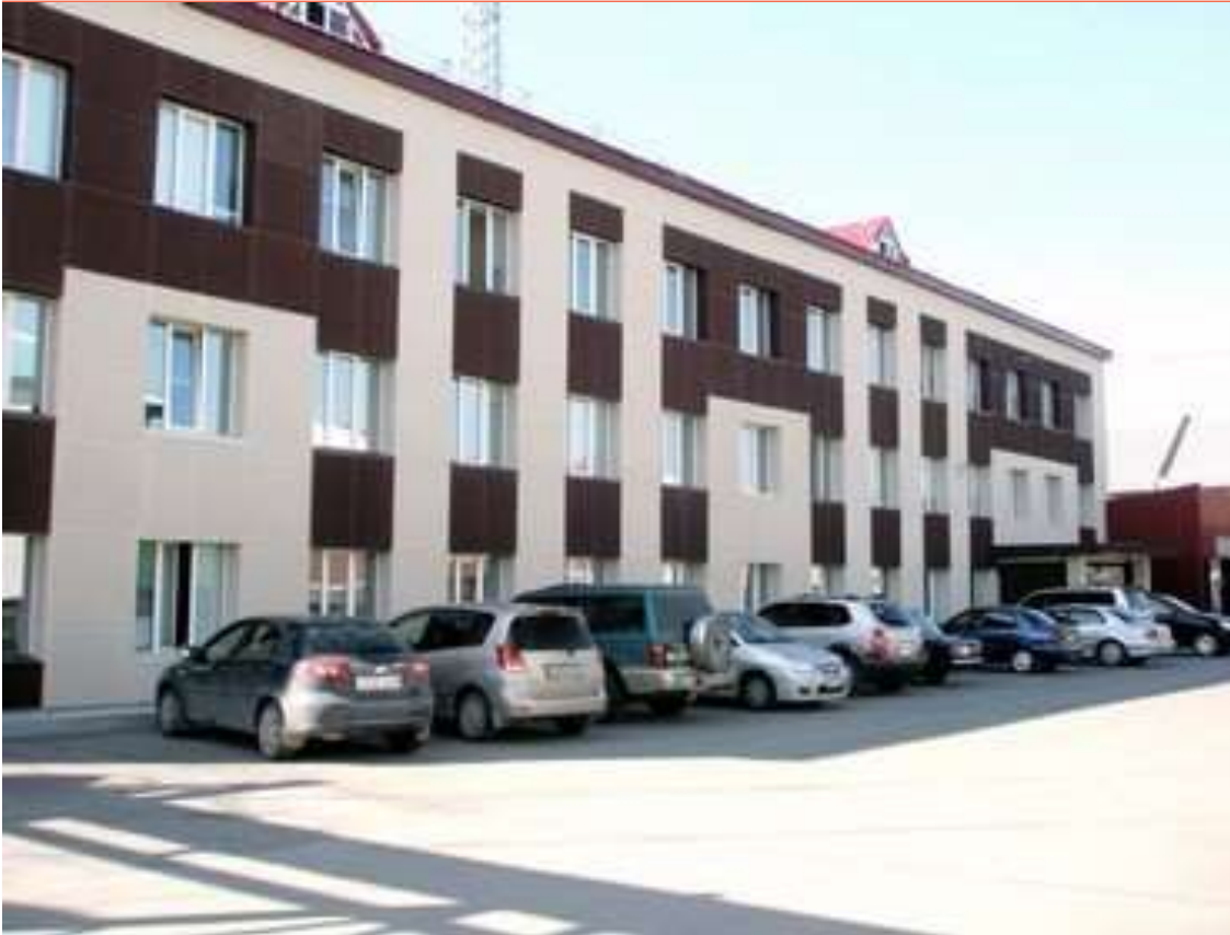
Рис. 8. Здание ЗАО «Институт Сибпроект» в Нижневартовске [56]

Когда произошел обвал цен на нефть, разведка, обустройство и добыча стали слишком дорогими в том смысле, что вырученные от продажи нефти деньги едва ли окупали затраты. Поэтому начался обвал цен и на инженерные изыскания и проектирование. На тендерных конкурсах стали побеждать недобросовестные мелкие компании с допусками, купленными у фактически криминальных СРО. А выигрывали они потому, что назначали цены за свои услуги, которые оказывались в 5–7 (!) раз меньше реально необходимых.