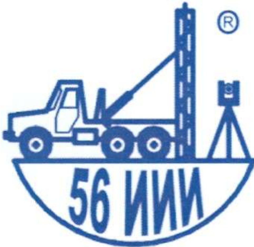
Рис. 5. Товарный знак бывшего 56-го ИИИ [55]

Конечно, в 1990-е и 2000-е годы было трудно, регулярного государственного финансирования не было, заказов не хватало и 56-й ИИИ стал гораздо слабее в экономическом плане. Но его право на выполнение инженерных изысканий было подтверждено соответствующими лицензиями, выданными Федеральной службой безопасности, Государственным комитетом РФ по строительству и жилищно-коммунальному комплексу, Федеральной службой геодезии и картографии России. И институт был готов качественно выполнять задачи любой сложности, если бы ему хотя бы не мешали [29, 39].