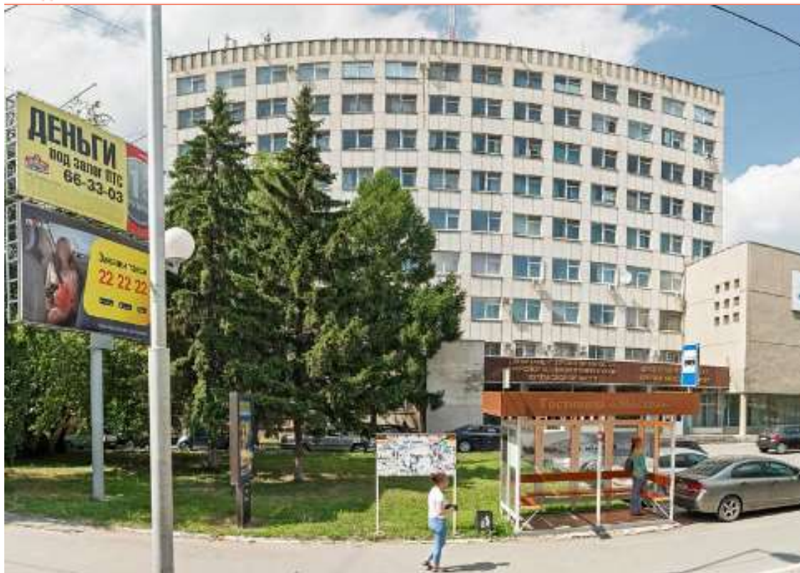
Рис. 7. Панорамный снимок здания КурганГражданПроекта (г. Курган) [56]