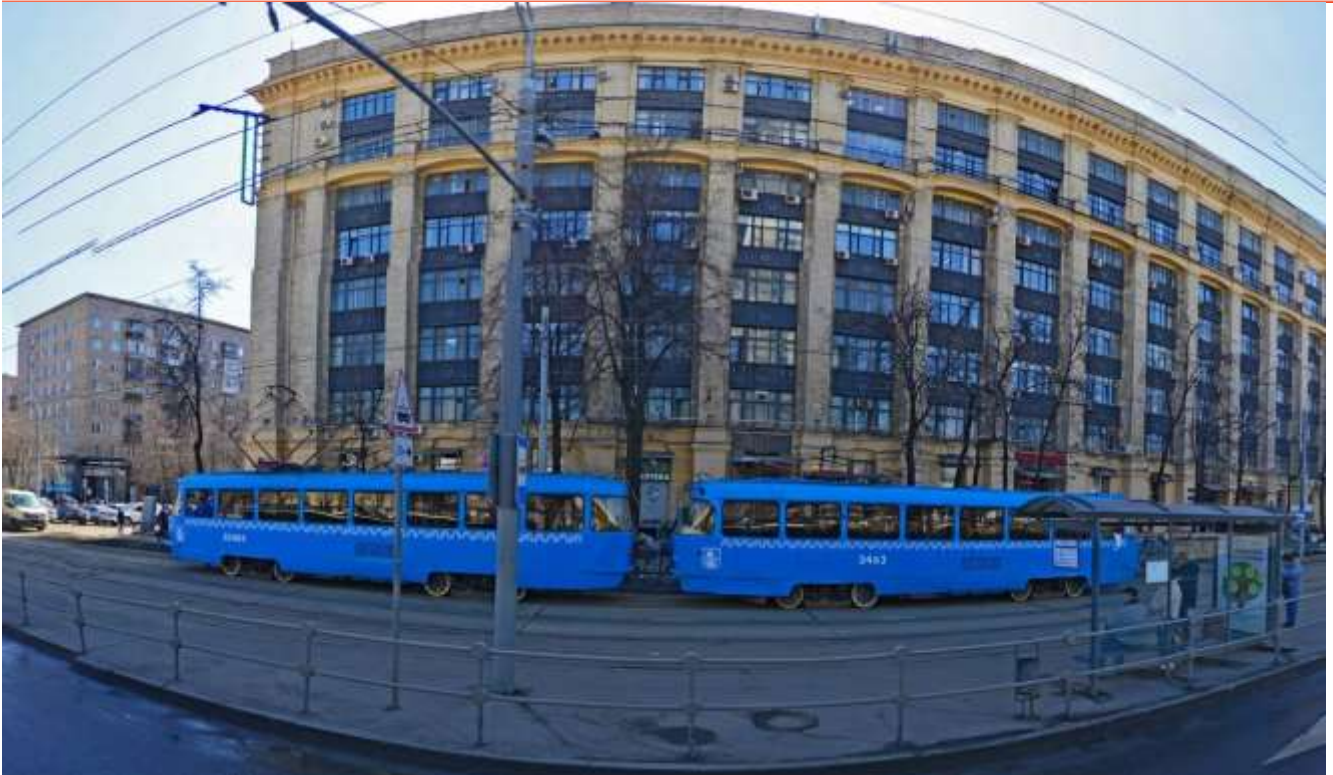
Рис. 2. Панорамный снимок здания института «Фундаментпроект» в Москве [56]

После распада СССР организация стала федеральным государственным унитарным предприятием, то есть ФГУП «Проектно-исследовательский институт “Фундаментпроект”».