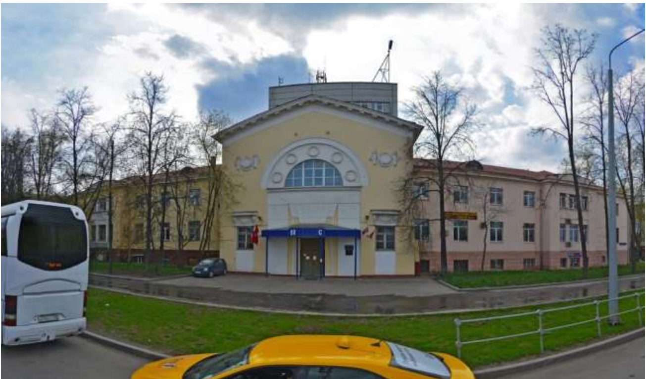
Рис. 1. Панорамный снимок главного здания ПНИИС в Москве [56]

ПНИИС имел не только необходимую материально-техническую базу, но и коллектив из высококвалифицированных специалистов, огромный опыт работы и уникальный архив материалов своих исследований.