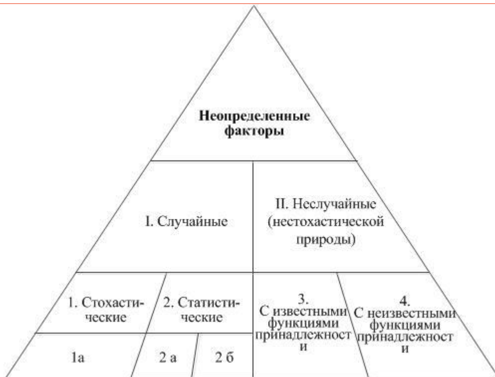
Рис.3. Пирамида понятий «неопределенные факторы в эколого-геологической системе, выделяемые по их природе» (объяснения в тексте)

На первом уровне пирамиды выделяют: «I. Случайные неопределенные факторы» и «II. Неслучайные (нестохастической природы) неопределенные факторы» - понятия наибольшего объема. На следующем более низком уровне выделяются понятия меньшего объема, но более содержательные по степени неопределенности, а именно: «1. Стохастическая неопределенность», «2. Статистическая неопределенность», «3. Неопределенность с известными функциями принадлежности» и «4. Неопределенность с неизвестными функциями принадлежности». При уточнении и логическом делении понятий «стохастическая неопределенность» и «статистическая неопределенность» можно далее выделить еще один уровень, в который войдут понятия «1а. Стохастическая неопределенность с известным законом распределения случайной величины», «2а. Статистическая неопределенность с неизвестным законом распределения случайной величины, но известным его типом (видом)» и «2б». Статистическая неопределенность, при которой ничего не известно о законе распределения случайной величины».