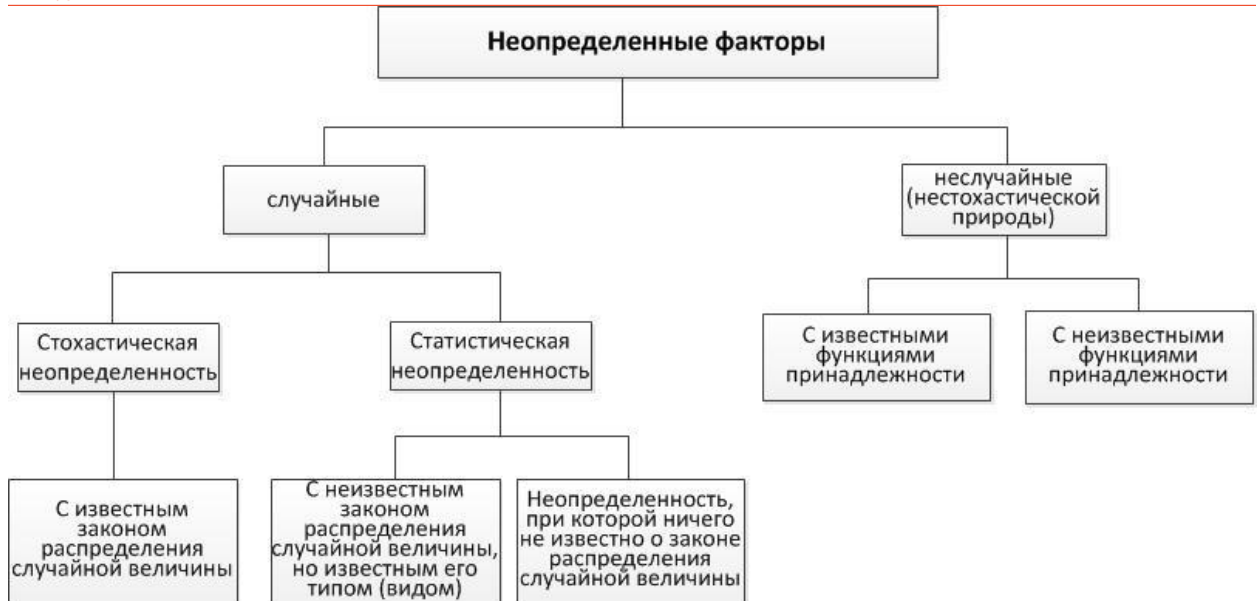
Рис.2. Классификация неопределенных факторов, описывающих ЭГС, по их природе

К случайным (стохастическим) относятся неопределенные факторы, обладающие свойством статистической устойчивости, которая чаще всего описывается в терминах функций распределения вероятностей. Функция распределения f(x) случайной величины \zeta , характеризующей процесс, определяется как f(x) = P\{\zeta \leq x\} , где P\{\zeta \leq x\} - вероятность того, что случайная величина \zeta примет значение, не превосходящее x .