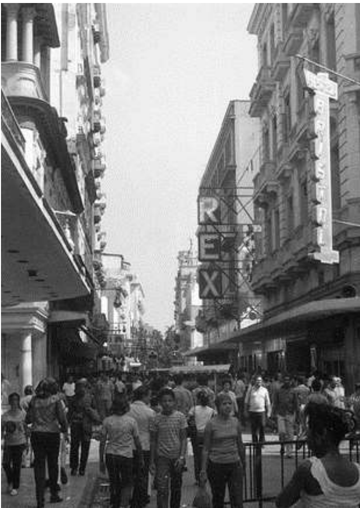
Рис. 4. Справа отель «Бристоль» в Старой Гаване, где мы жили 9 дней