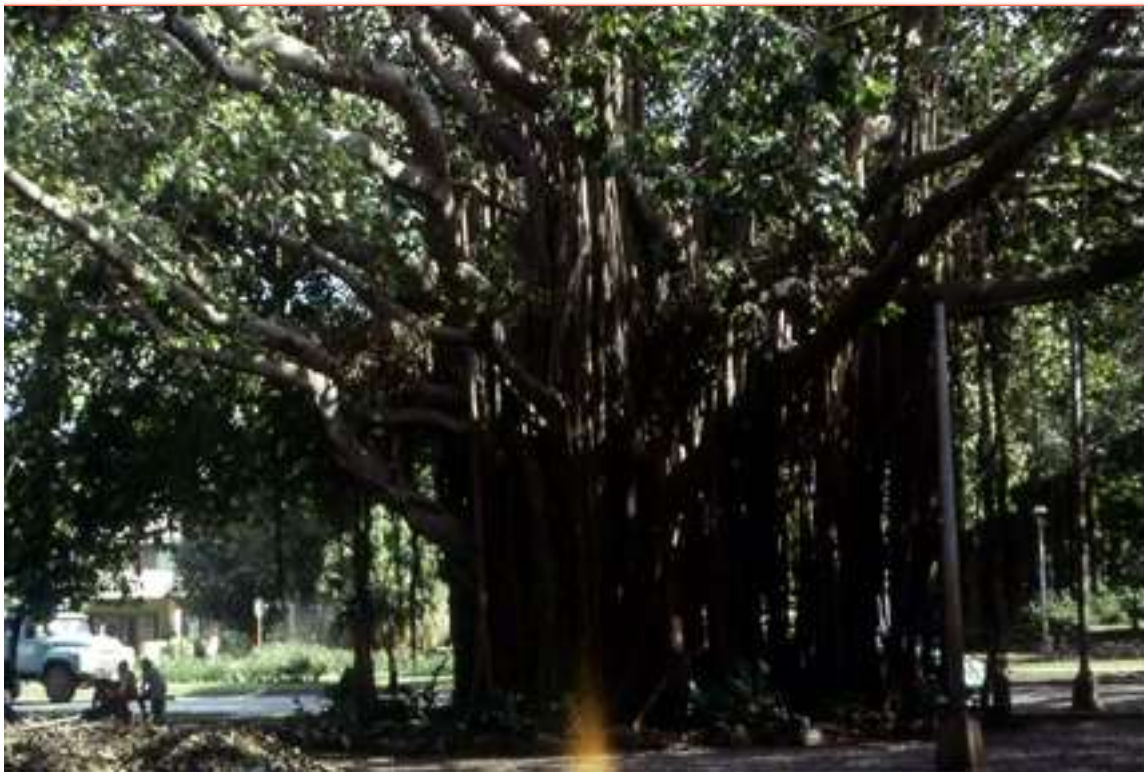
Рис. 2. «Слоновое дерево» вблизи здания ГКЭС