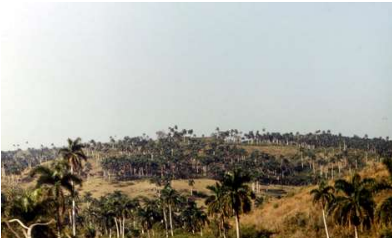
Рис. 3. Типичный зимний пейзаж между Гаваной и Матансасом (вся трава съедена начисто)

Природа Кубы разительно отличается от нашей (рис. 2, 3). Я там не видел ни одного знакомого растения, кроме картошки и кукурузы американского происхождения. Даже сосны – другие, трёхигольчатые (кубинская сосна «пино»), а из животного мира знакомыми были только воробьи, да белые цапли.