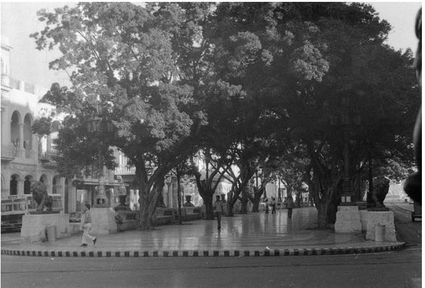
Рис. 5. Прадо во всём своём блеске

Недалеко от «Бристоля» в сторону набережной сохранилась пешеходная улочка Прадо, сплошь вымощенная полированным мрамором (рис. 5). В старые времена здесь под сенью крон тропических деревьев прогуливалась местная знать, а полиция зорко следила, чтобы простолюдины не мешали «обществу».